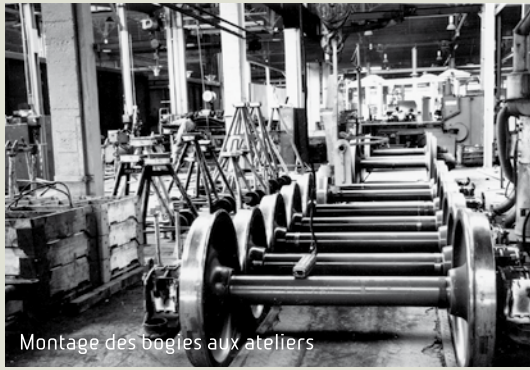
Montage des bogies aux ateliers

Q uand on observe une photographie aérienne de l'agglomération dijonnaise, on repère tout de suite la nationale 74 - à Chenôve, avenue Roland Carraz - large et rectiligne, qui semble constituer l'épine dorsale des quartiers sud. Mais cette artère incontournable et passagère n'irrigue guère les rues adjacentes, au contraire, elle tranche et sépare !