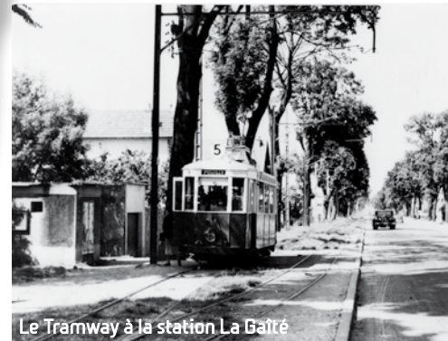
Le Tramway à la station La Gaîté