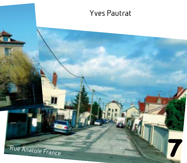
Rue Anatole France