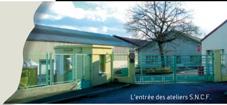
L'entrée des ateliers S.N.C.F.

Suite à nos questions, cette famille a envie de nous transmettre un message : « J'aurais envie de dire aux habitants d'autres quartiers que, comme dans une vie personnelle, professionnelle ou sociale, le respect de chacun dans ses fonctionnements, ses habitudes ou ses particularités est le critère de base d'une vie en communauté. »