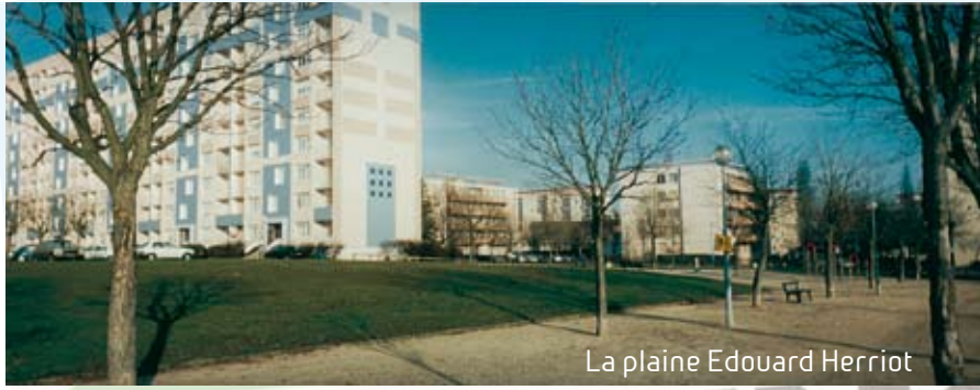
La plaine Edouard Herriot