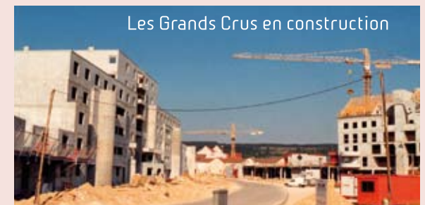
Les Grands Crus en construction

Desroches et bien d'autres encore. On débattait, on rédigeait des contributions, on se revoyait,