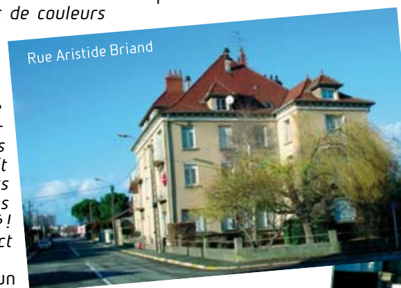
Rue Aristide Briand