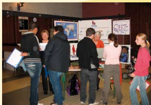
Le stand de "Partage Bourgogne"

Il y a un dicton qui annonce et qui pourrait faire un joli sujet au BAC : "Celui qui donne ne doit jamais s'en souvenir et celui qui reçoit ne doit jamais l'oublier." Nous avons